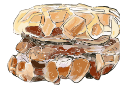
Pennsylvania / 13.90 €

smoked BBQ Turkey Eisbergsalat • Granny Smith Apfel • gegrillte Zwiebeln Röstzwiebeln • BBQ Sauce • Bratapfelketchup