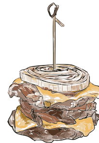
Flying Dutchman / 16.50 €

crunchy Wildschwein Patty • mariniertes Rotkraut gegrillte Zwiebeln • gegrillte Champignons Wildpreiselbeeren • Wildmayo