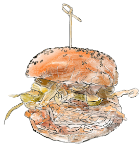
Thanks Giving / 14 €

serviert in zwei karamellisierten Zwiebeln 2x 100% Rindfleisch Patty • crunchy Onion-Nest 2x Cheddar Cheese • Cheddar Cheese Sauce